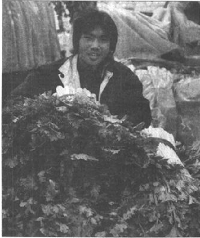
12月13日,乌鲁木齐北园春农贸市场,批发商在叫卖芹菜。近年,乌鲁木齐市“菜篮子”工程建设取得明显成效。虽已进入隆冬季节,但乌鲁木齐各大农贸市场,新鲜蔬菜品种丰富、应有尽有。

对于今年我国经济的出色表现,朱之鑫认为,这是政策和市场驱动力共同作用的结果,是国内因素和国际因素相互作用的结果。他说,积极的财政政策和稳健的货币政策是促使今年经济稳定增长的关键因素,其中今年的1500亿元国债资金较好地发挥了示范和引导作用,带动了投资的快速增长;世界经济的温和复苏及美元贬值促进了中国出口的快速增长;加入世贸组织后,我国的市场更加开放,多元化的经济增长空间得到拓展。此外,我国连续5年来实施的改革开放和扩大内需的政策效应逐步释放,经济内在增长的动力得到了增强。